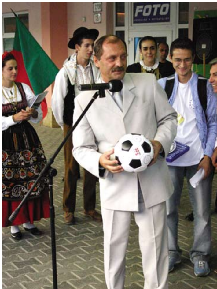
FOTO: JUDr. Cyril Betuš Istarosta MČ Košice - Sídliisko Ťahanovce/ pri odovzďavaní daru portugalskému súboru, ktorého predstaviteľa prisľúbili loptu odovzdať futbalovému klubu BENEFICA LISABON