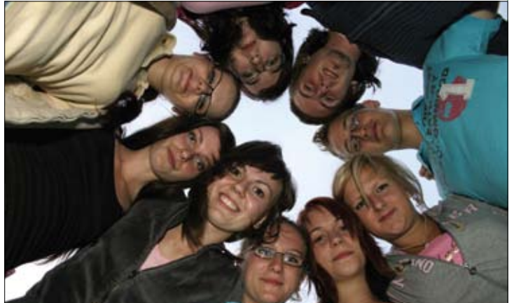
Víkendové tréningy nie sú len o sústreďení, ale aj o poriadnej dávke zábavy

vanie, ako aj plánovanie budúcich kultúrnych a športových aktivít. Najbližšou bude streetballový turnaj na skateparku spojený s v poradí už tretou sériou koncertov amatérskych hudobných skupín s názvom „Hviezdy pod hviezdami 3“. Táto prázdninová akcia je naplánovaná na štvrtok v posledný augustový týždeň v areáli skateparku. Blížšie informácie o činnosti Pavúkov a ich pripravovaných aktivitách nájdete na ich webstránke http://www.pavuci.wz.cz .