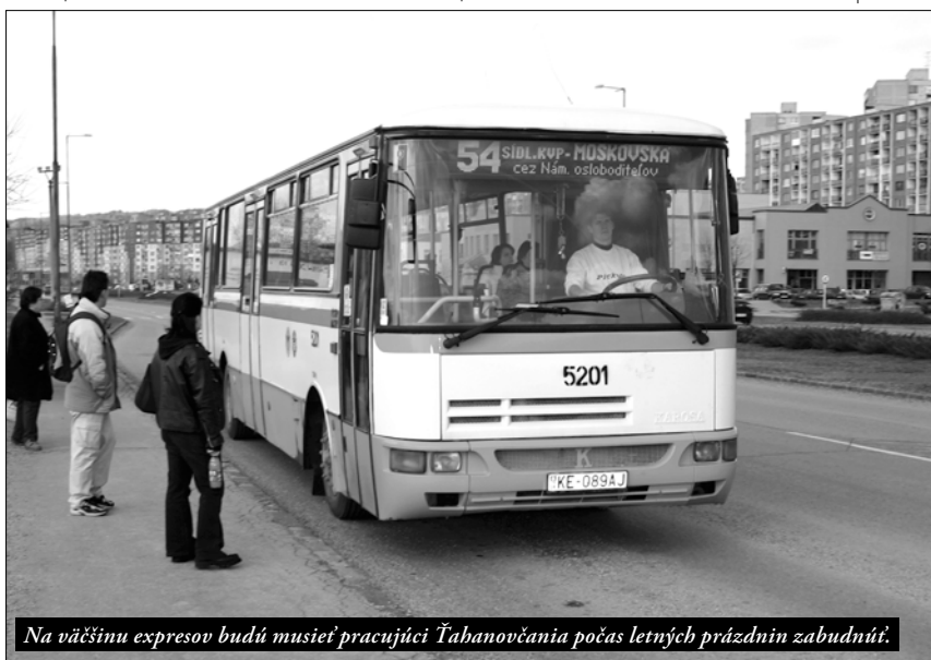
Na väčšinu expresov budú musieť pracujúci Ťahanovčania počas letných prázdnin zabudnúť.

(Celý príspevok poslankyne Danice Nagyovej si môžete prečítať na internetovej stránke mestskej časti http://mutah.tahanovce.sk )