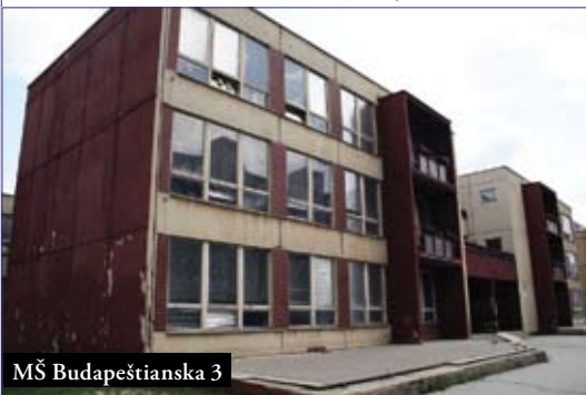
MŠ Budapeštianska 3