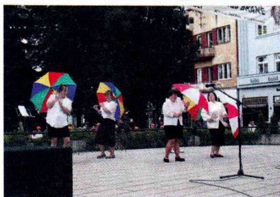
Radosť s tanca...