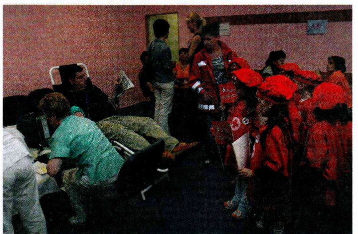
Naša mládež pri mobilnom odbere krvi