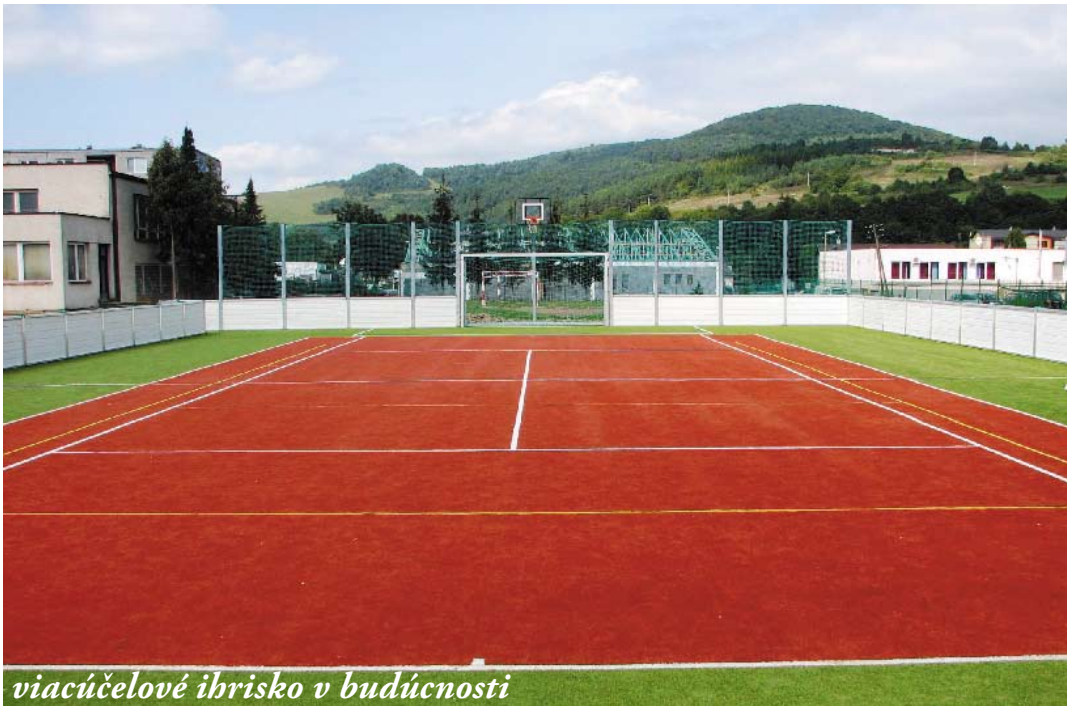
viacúčelové ihrisko v budúcnosti