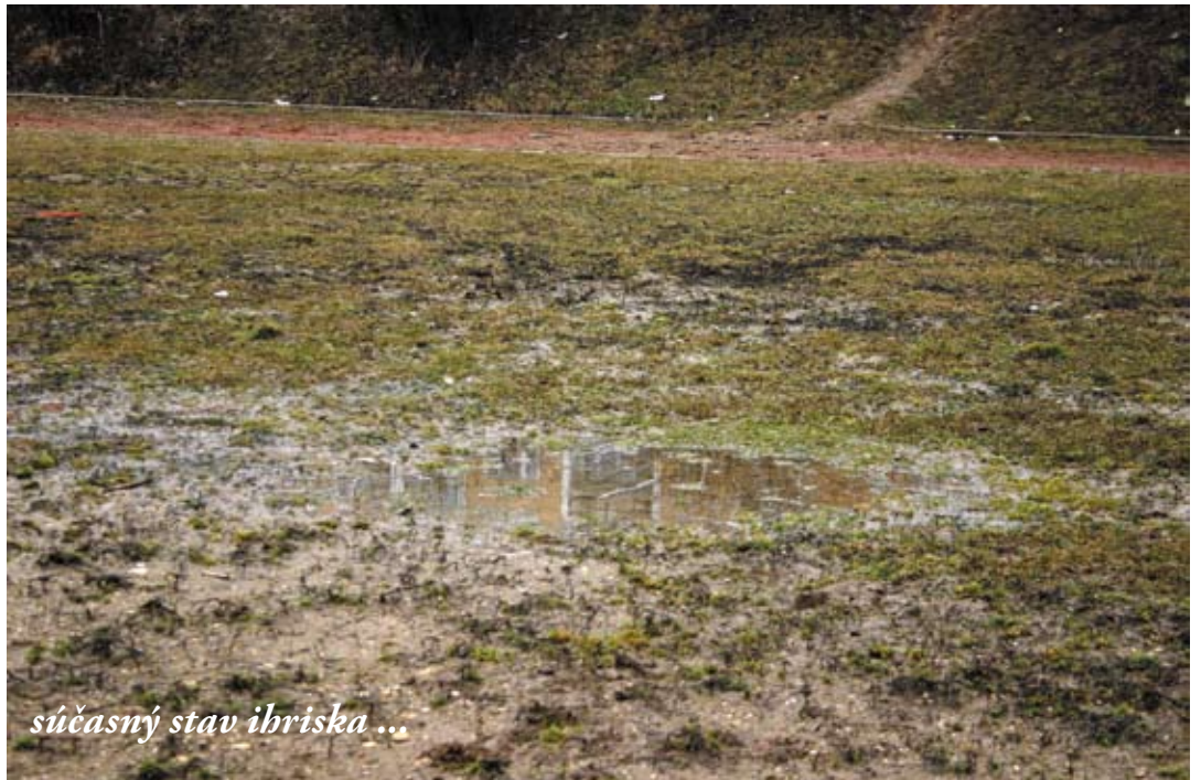
súčasný stav ihriska ...

(Čo sa týka Lidlu, podľa posledného vyjadrenia investora, je realizácia v štádiu získavania povolení a na otázku časového horizontu začiatku výstavby, nebola redakcii daná žiadna konkrétna odpoveď. Pozn.red.)