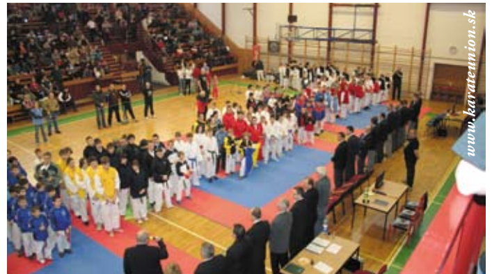
Slávnostné otvorenie súťaže