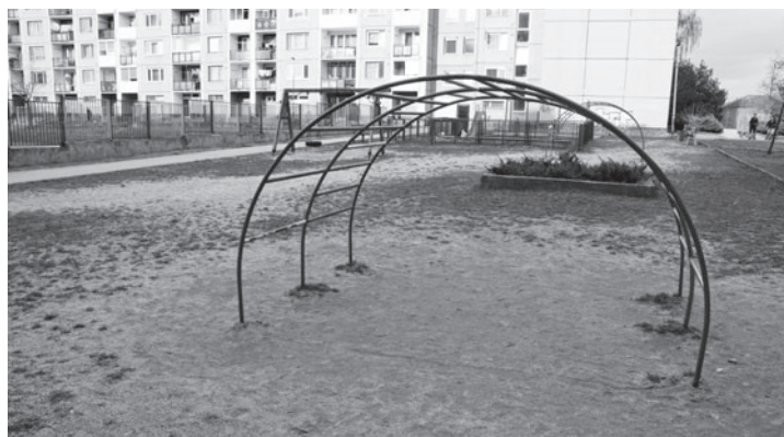
Na tomto mieste bude ihrisko pre hendikepované deti.

Mestská časť sa uchádza aj o dotáciu určenú pre mestské časti, o ktorú sú mestské časti povinné požiadať. Z položky kapitálové výdavky sa mestská časť Košice-Sídliisko Ťahanovce uchádza o pridelenie finančných prostriedkov vo