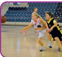
CBK Cassovia Košice

– basketbalový klub, ktorý po sezóne 2011/2012, kedy získal titul Majstra SR kadetiek, v tomto roku získal na Majstrovstvách SR bronz v kategórii mladšie mini.