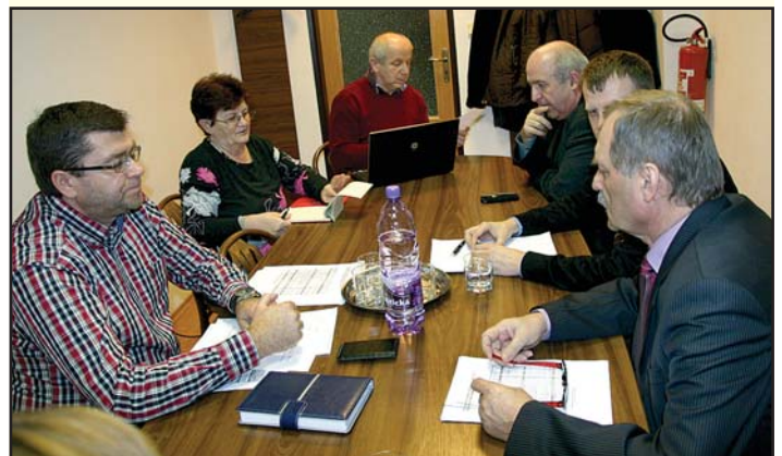
Finančná komisia počas rokovania.

Finančnú komisiu zastupujú piati poslanci miestneho zastupiteľstva.