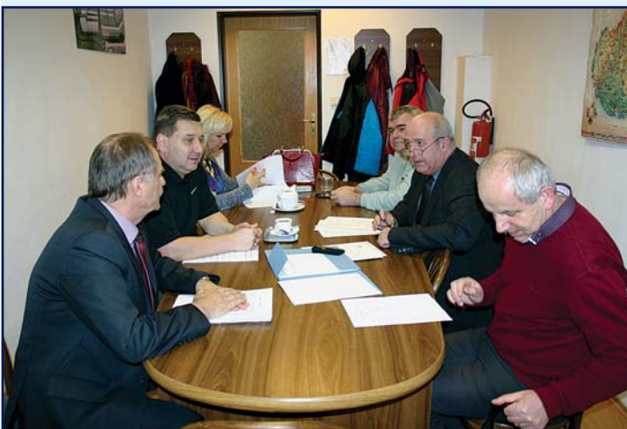
Komisia pre udeľovanie vyznamenaní a verejných ocenení.

V súčasnosti predseda komisie vyzval poslancov i širokú verejnosť, aby navrhli vhodných kandidátov na Cenu mestskej časti Košice-Sídlisko Tahanovce, ktorá bude slávnostne odovzdaná v rámci osláv 30. výročia mestskej časti 9.5.2015 vo veľkej zasadačke miestneho úradu. Tieto návrhy boli vyhodnotené na zasadnutí komisie v 10. týždni roku 2015 a definitívne odsúhlasené na zasadnutí MZ 18.3.2015.