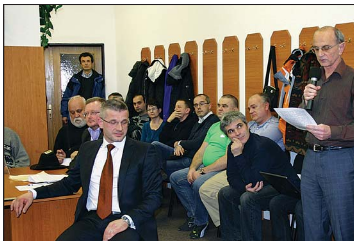
Na rokovani volených zástupcov samosprávy sa pravidelne zúčastňuje aj verejnosť.