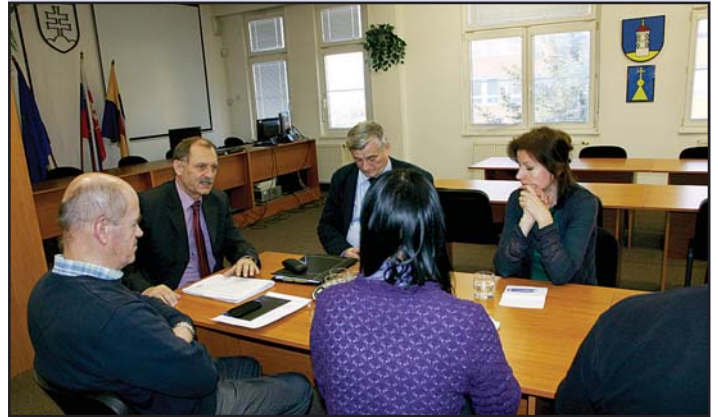
Zasadnutie komisie výstavby.

Košice na roky 2015-2020”, budúcnosť dopravy na sídlisku Ťahanovce v súvislosti s pripravovaným projektom „Stratégia dopravy a dopravných stavieb”, rokovanie s košickou cyklokoordinátorkou ohľadom predloženého návrhu plánovaných cyklotrás pre potreby cyklo dopravy a cykloturistiky v rámci pripravovaného plánu cyklistickej dopravy v Košiciach. Ďalej informoval o schválenom rozpočte mestskej časti na rok 2015 a vyzval členov komisie na predloženie podnetov, okruhov problémov, ktorými sa bude komisia zaoberať na svojich rokovaníach v nasledujúcom období.