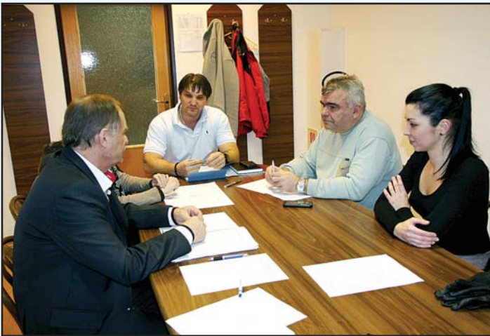
Komisia komunitného rozvoja, kultúry a športu pri práci.

Na nasledujúcich zasadnutiach komisie sa jej členovia venovali príprave kultúrno - športových podujatí, ktoré od januára 2015 organizujú vo veľkom počte. Bol spracovaný harmonogram podujatí, ktorý je mesiac vopred zverejnený na webovom sídle mestskej časti. Vzhľadom na to, že v roku 2015 uplynie 30 rokov od položenia základného kameňa mestskej časti, komisia pripravuje množstvo podujatí práve na mesiac máj, kedy sa každoročne organizujú Dni mestskej časti.