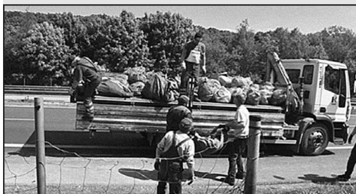
Očista verejných priestorov (dobrovoľníci a dobrovoľnícke organizácie v súčinnosti s mestskou časťou Košice-Sídliisko Ťahanovce)

... ďalšie aktivity na rozvoji a zveladení sídliska Ťahanovce.