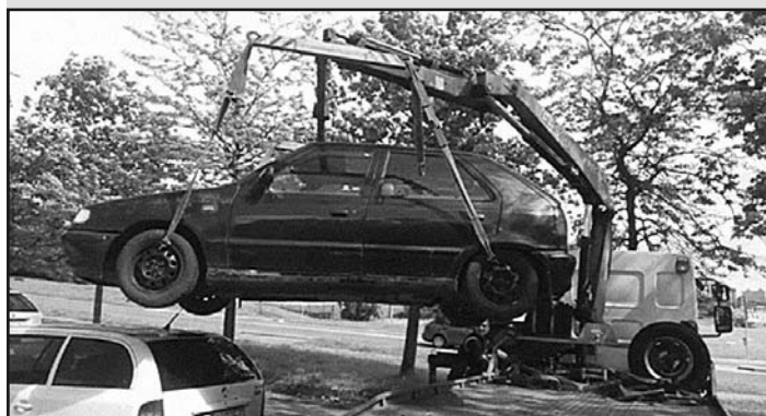
Odstraňovanie vrakov v súčinnosti s mestskou políciou