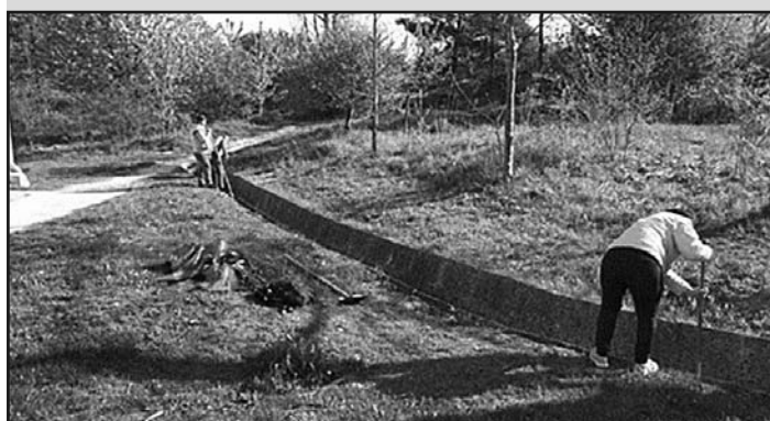
Čistenie rigolov v spolupráci s Arcidiecéznou charitou