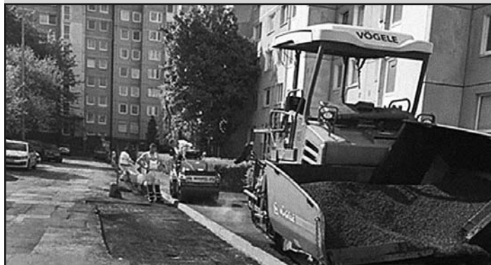
Asfaltovanie komunikácií (mesto Košice)