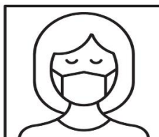
Povinnosť mať prekryté horné dýchacie cesty

Na všetky vstupy do prevádzky viditeľne umiestniť oznam o povinnosti nosiť ochranu dýchacích ciest (vzor piktogramu).